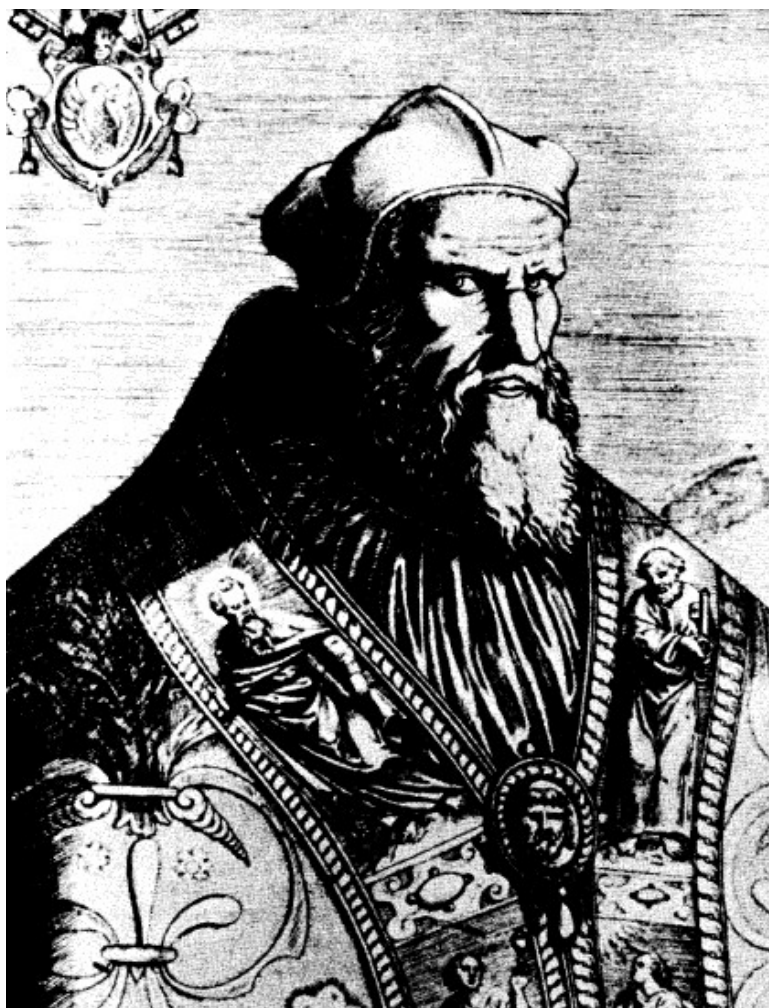
Grégoire XIII, qui fut pape de 1572 à 1585, a corrigé l'erreur qui se trouvait dans le calendrier julien. Son calendrier, appelé grégorien, est actuellement en usage.